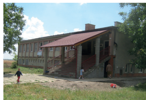
Univerzitné sociálne centrum svätého Don Bosca, Jarná Jarná 322