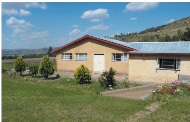
Klinika Maqhaka, Lesotho