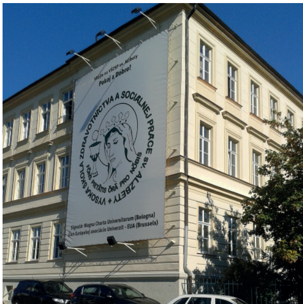
Námestie 1. mája 1 Bratislava