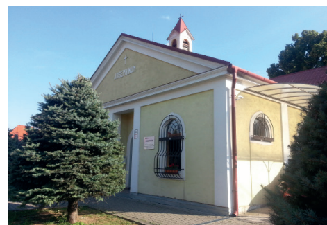
Univerzitné azylové centrum pre rodiny Jozefinum Dolná Krupá 293