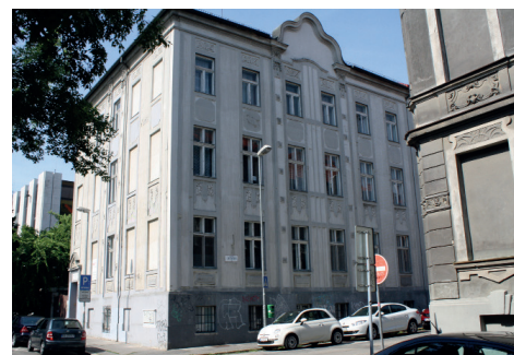
Univerzitné kolégium Bl. Zdenky Šelingovej a Univerzitné pastoračné centrum Bratislava Leškova 6, Bratislava