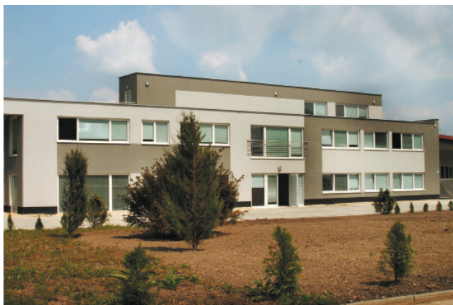
Polianky 6205-4/A Bratislava