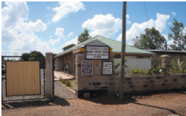
Klinika pre chudobných svätého Rafaela, a svätej Bakithy, Mihango, Keňa