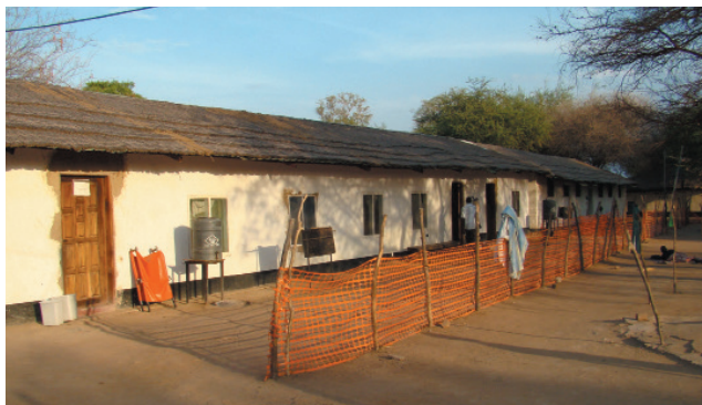
Nemocnica Marialou, Sudán