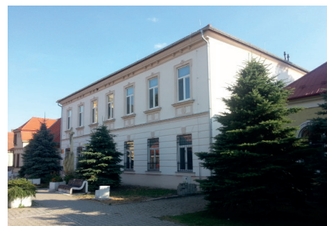
Vzdelávacie a rozvojové stredisko Svätej Matky Terezy, IVSP pri VŠSA, Dolná Krupá